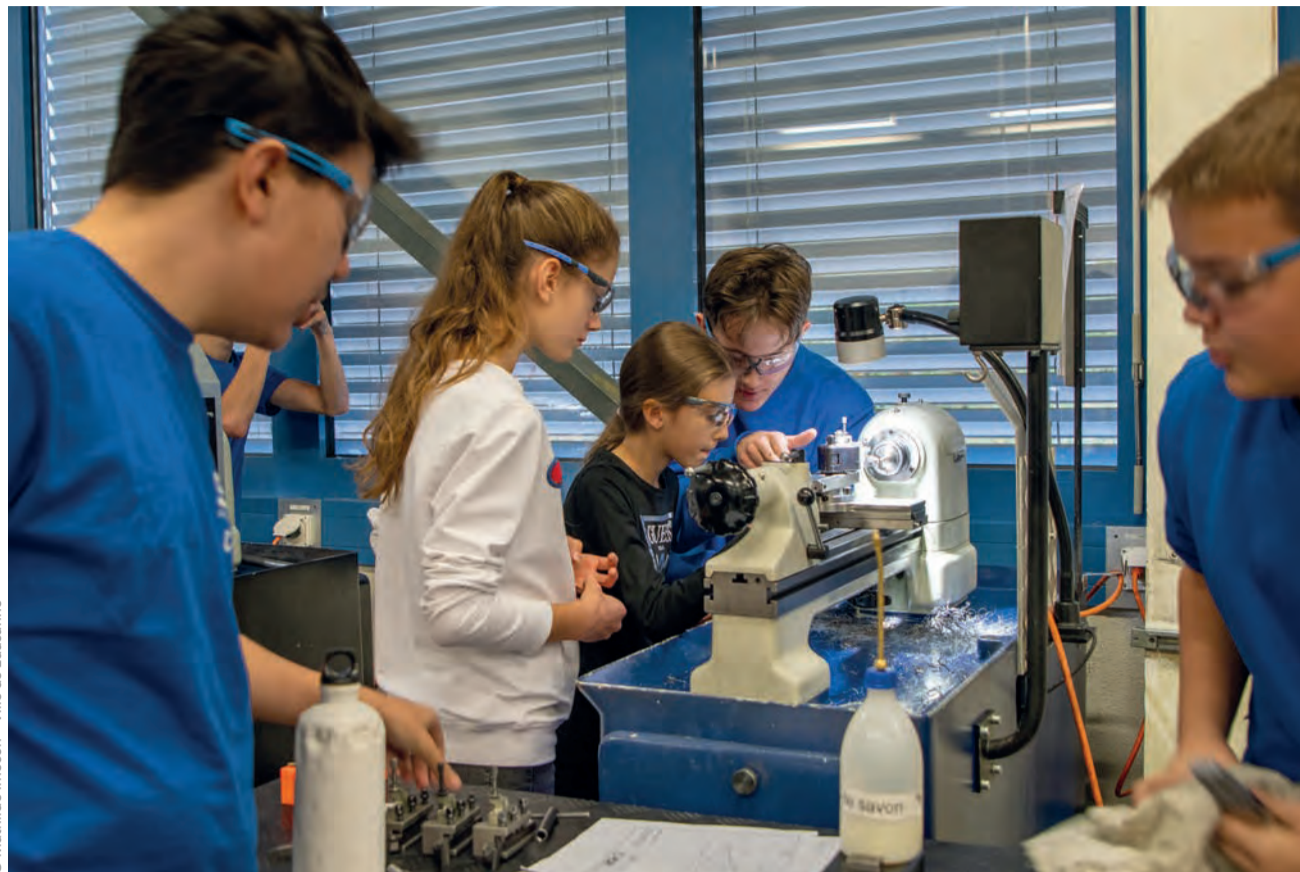
© Mathilde Imesch - Ville de Lausanne

Pour la Ville de Lausanne, participer à la JOM contribue à aug-