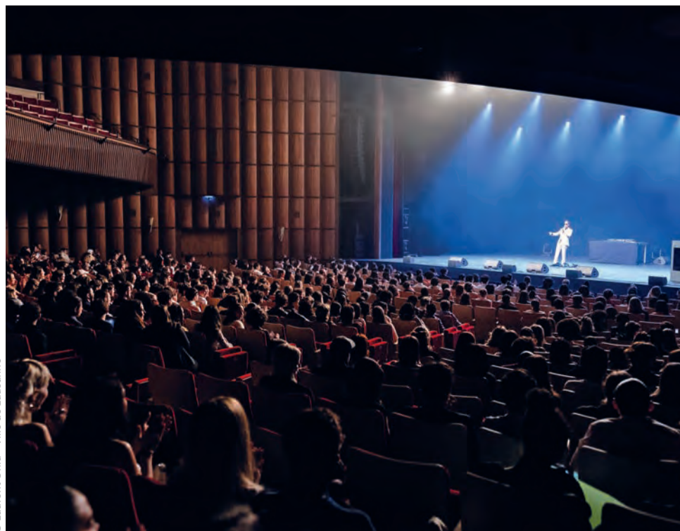
La fête a eu lieu au Palais de Beaulieu.

Avant le spectacle, un apéritif était offert et des stands d'information et de prévention étaient proposés sur les thématiques liées à la vie des jeunes adultes. Enfin, un cadeau a été remis à chacune et chacun en souvenir de ce moment unique. | G. Conne