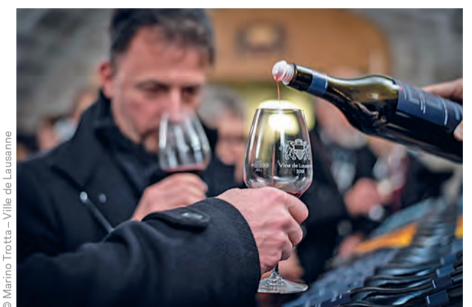
Des lots de 24 à 90 bouteilles seront mis aux enchères.

Quand? Mercredi 6 décembre, 17h30 Où? Carnotzet de la Municipalité, entrée par le passage de l'Hôtel de Ville Sur réservation: vignobles@lausanne.ch ou 021 315 42 30